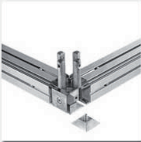
IN-FRAME DADO5 + Q-be5