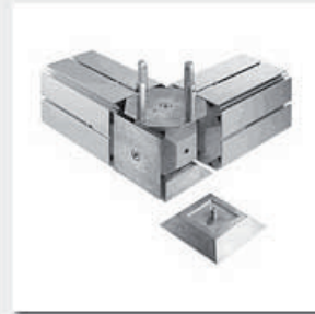
IN-FRAME DADO10 + Q-be10