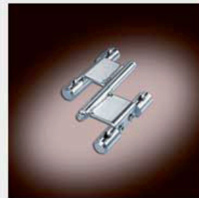
Scharnier 50 x 50 DADO, verzinkt