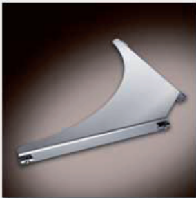
Knotenblech für IN-FRAME DADO 5